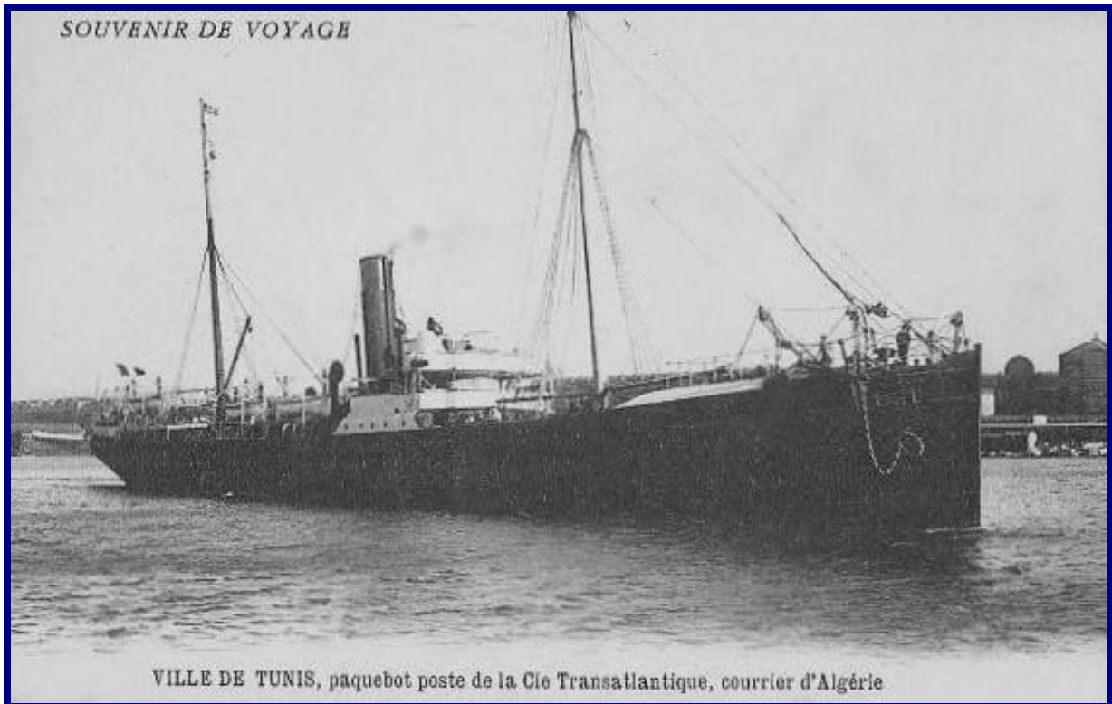
Ville de Tunis, paquebot poste de la Cie Transatlantique, courrier d'Algérie.