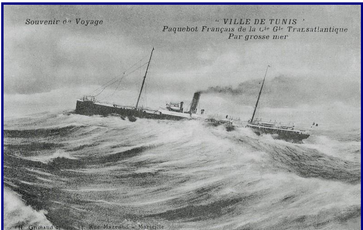
Ville de Tunis Paquebot Français de la Cie G le Transatlantique Par grosse mer.