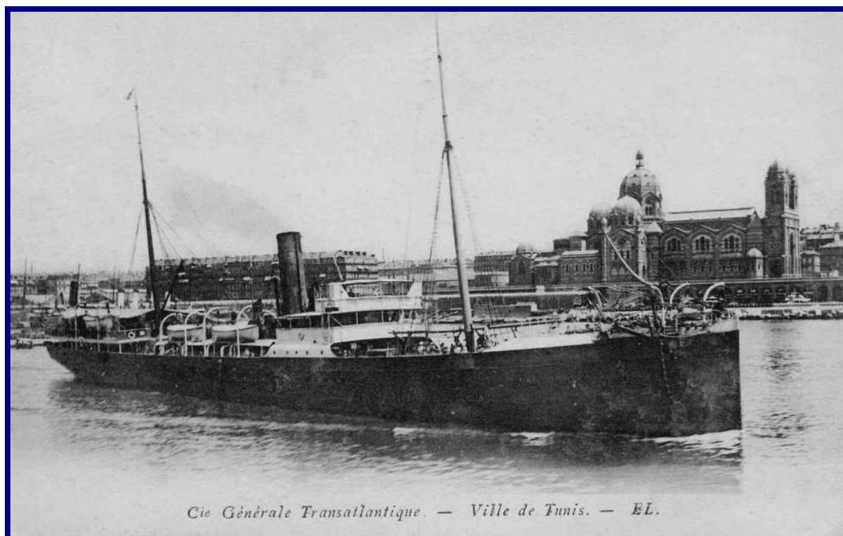
Cie Générale Transatlantique – Ville de Tunis.