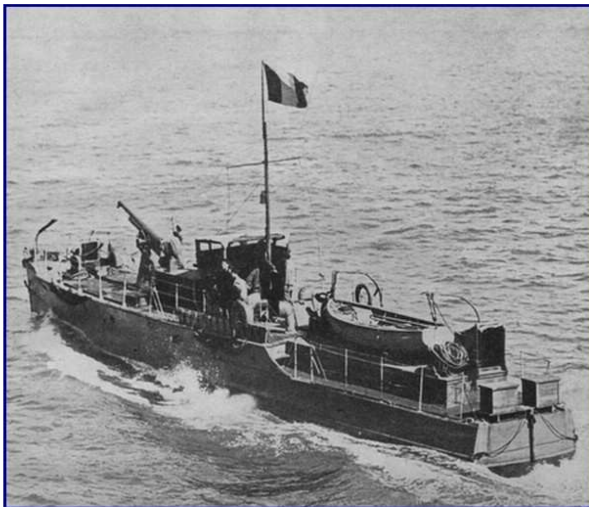
Vedette Canadienne (type ML) armée d'un canon de 75 Navire non numéroté