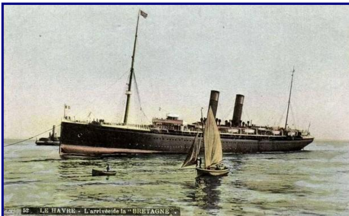
Le Havre – L'arrivée de la « Bretagne ».