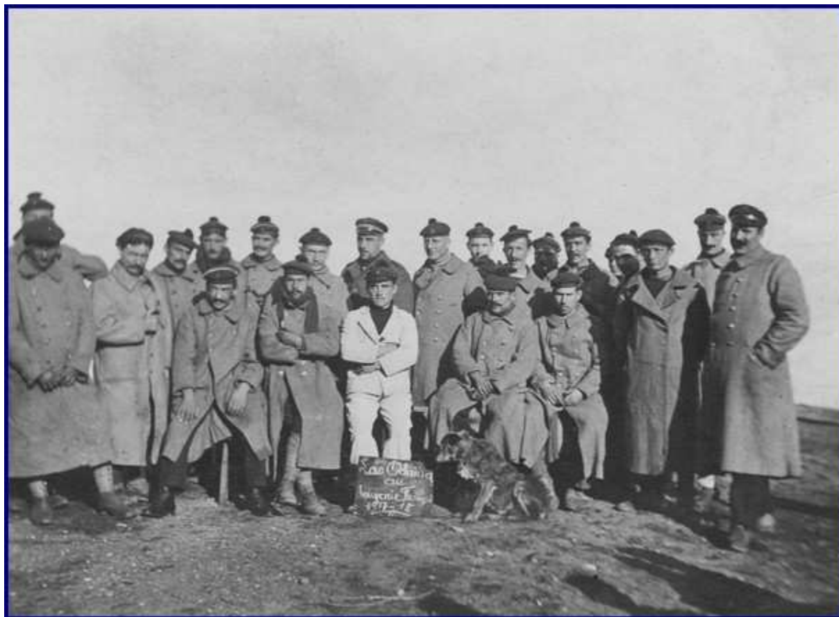
Marins – Lac Ochrida Au souvenir français – 1917 / 1918.