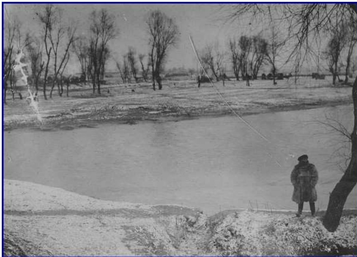
Sur la route de Durazzo à Monastir : A l'ouest du lac Prespa (janvier - mars 1917). Près du lac Prespa. (ex commune de Leskovec, actuellement Leskoec)

Collection : Médiathèque de l'Architecture et du Patrimoine. Ministère de la culture