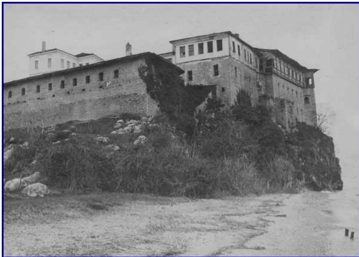
Monastère de Saint Nahoum Sur la route de Durazzo à Monastir : Au sud du lac d'Okrida (janvier - mars 1917). Vue prise de la route qui est actuellement sous le feu direct des Autrichiens. Le ravitaillement se fait la nuit.