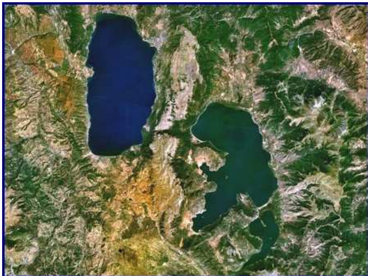
Photographie satellite des lacs