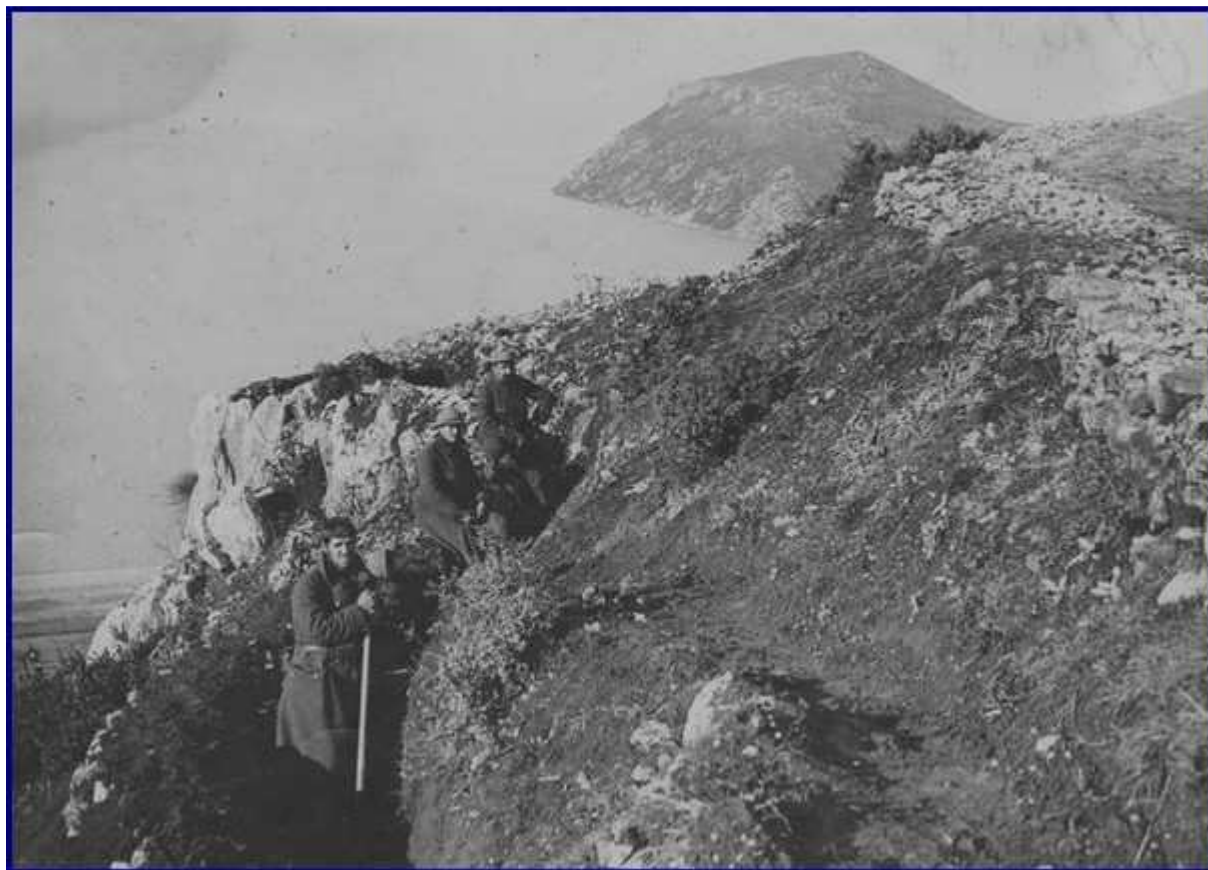
Sur la route de Durazzo à Monastir : Au sud du lac d'Okrida (janvier - mars 1917). Lac d'Okrida : La dernière tranchée française au nord de Ljubanista sur le chemin muletier d'Okrida. Le rocher en face est occupé par les Bulgares