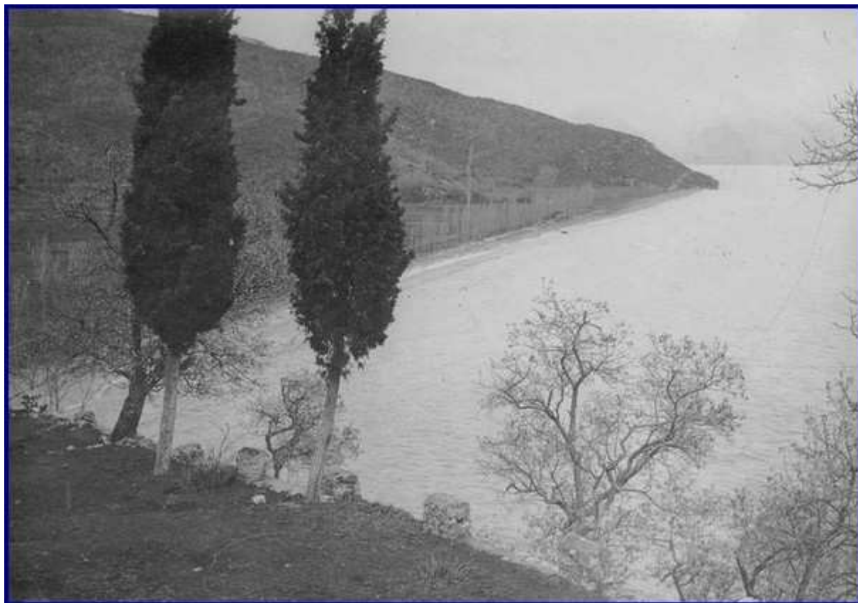
Monastère de Saint Nahoum Sur la route de Durazzo à Monastir : Au sud du lac d'Okrida (janvier - mars 1917). Lac d'Okrida : Position autrichienne devant le monastère de Saint-Nahoum. Vue prise par une fenêtre du monastère