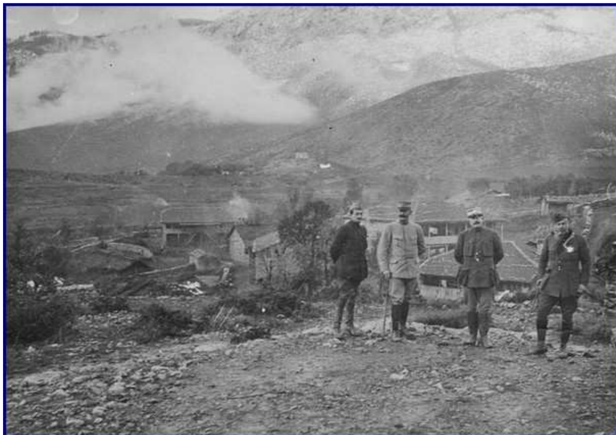
Sur la route de Durazzo à Monastir : A l'ouest du lac Prespa (janvier - mars 1917). Le général Salle, commandant la colonne des lacs Prespa et d'Okridaa, avec ses officiers. (ex commune de Sulin, actuellement Diellas)