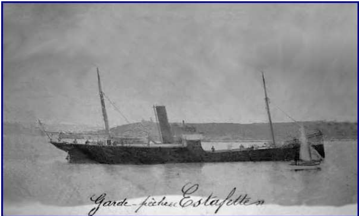
Garde Pêche ESTAFETTE