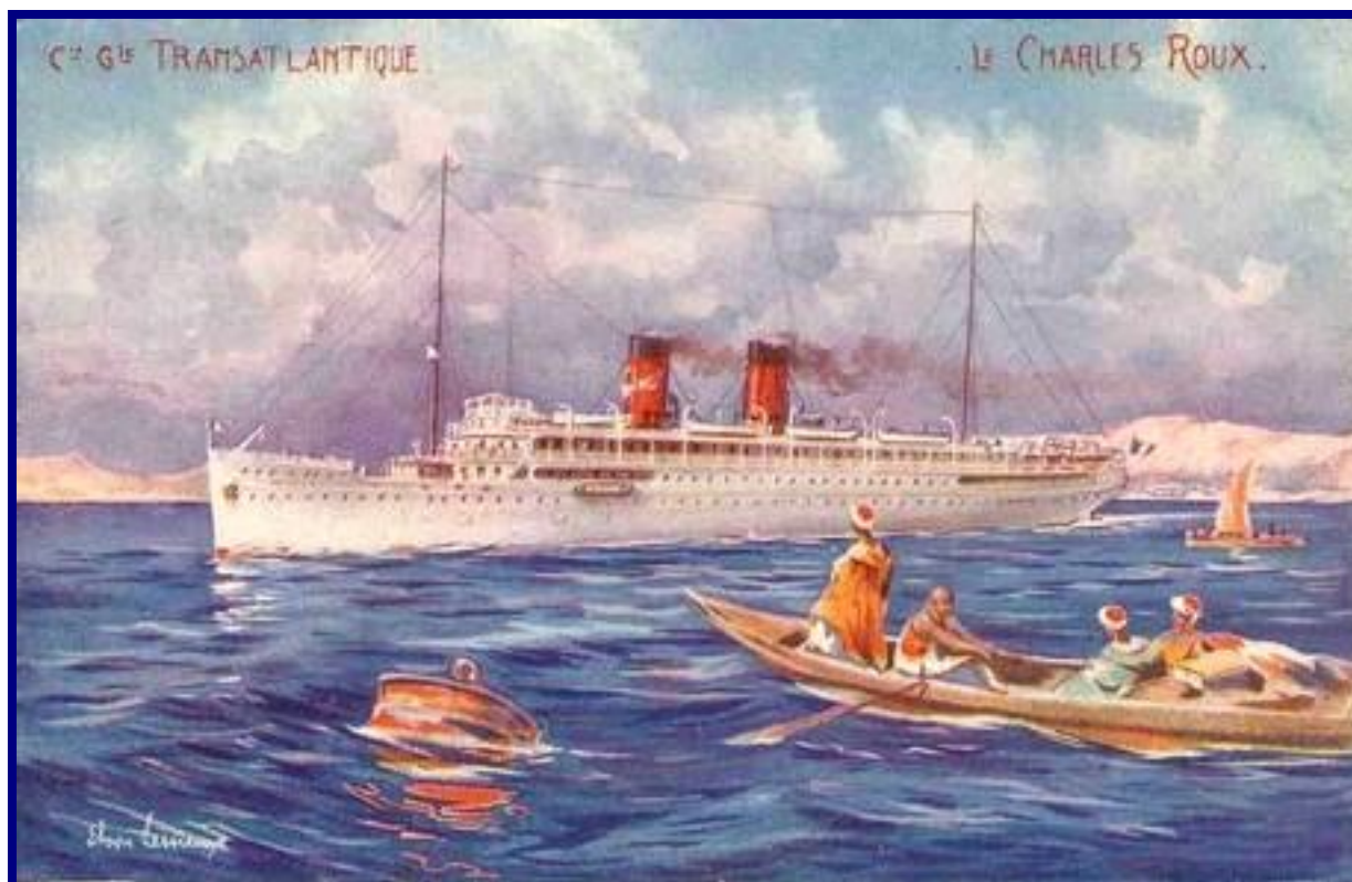
C ie G ie Transatlantique – LE CHARLES ROUX.