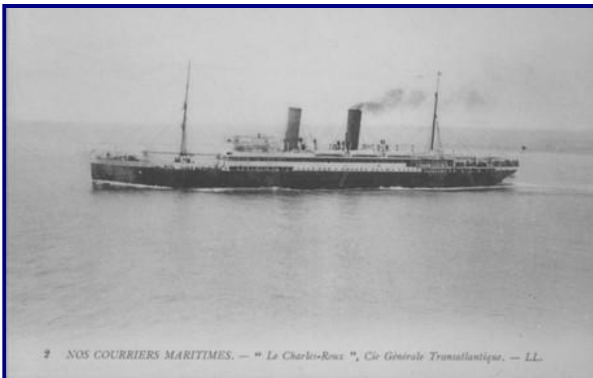
Nos courriers maritimes – « Le Charles Roux », C ie Générale Transatlantique.