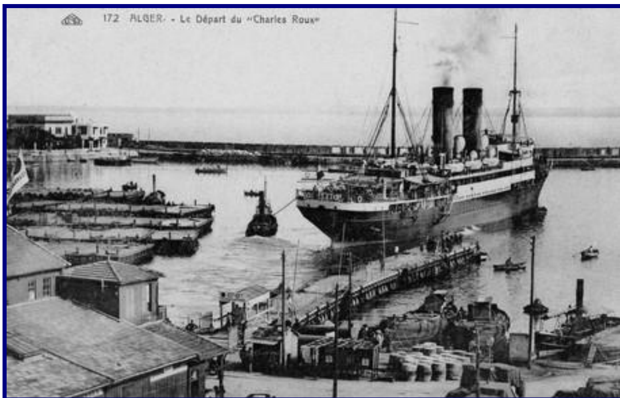
Alger – Le départ du « Charles Roux ».