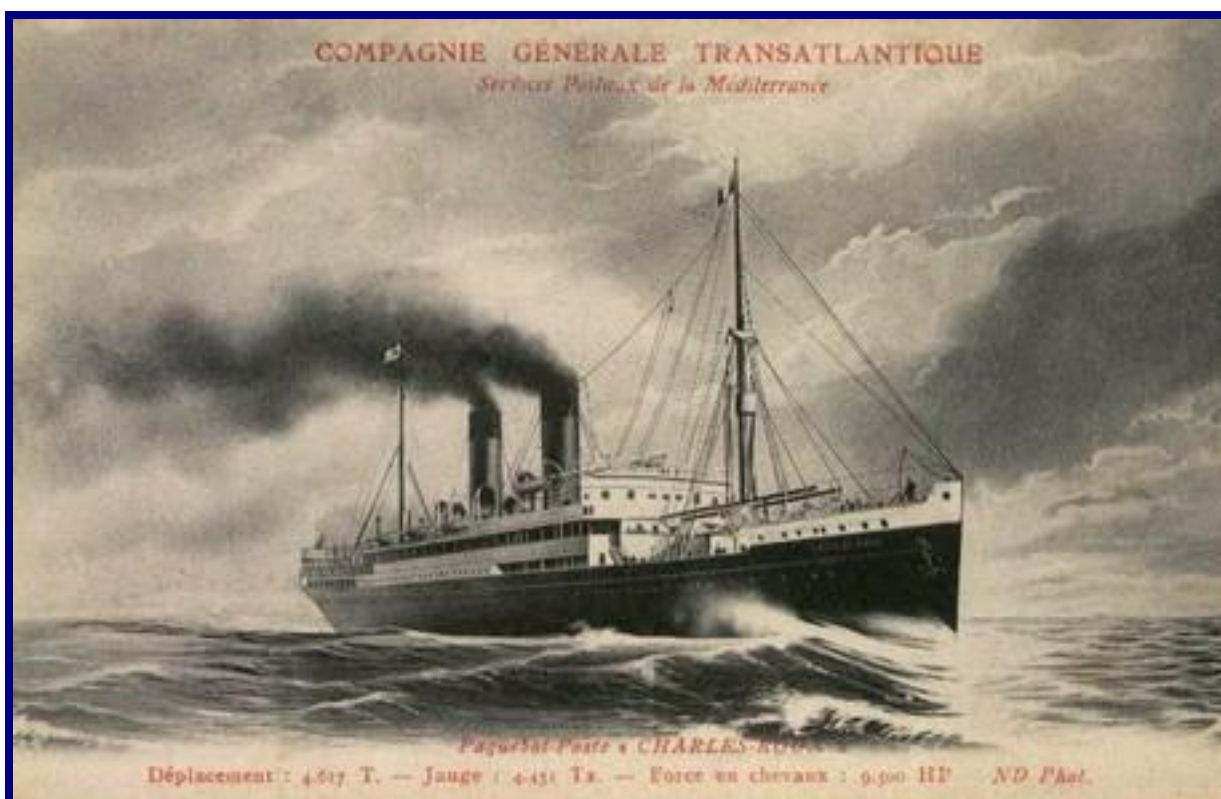
Compagnie Générale Transatlantique Services Postaux de la Méditerranée Paquebot Poste « CHARLES ROUX »

Navires de la Grande Guerre – Navire CHARLES ROUX Fiche récapitulative mise à jour le 03/03/2008 – V3 Auteurs : Yves DUFEIL – Franck LE BEL – Marc TERRAILLON