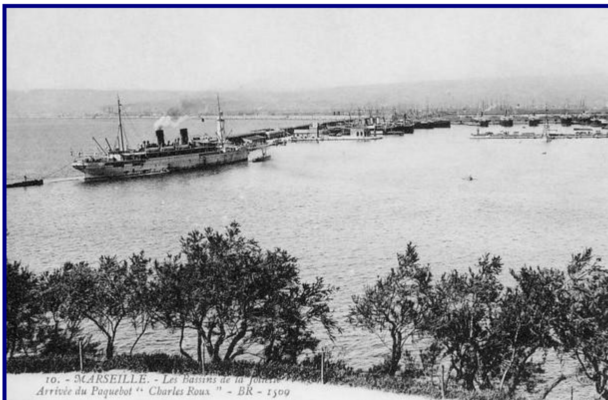
Marseille – Les bassins de la Joliette. Arrivée du Paquebot « Charles Roux ».