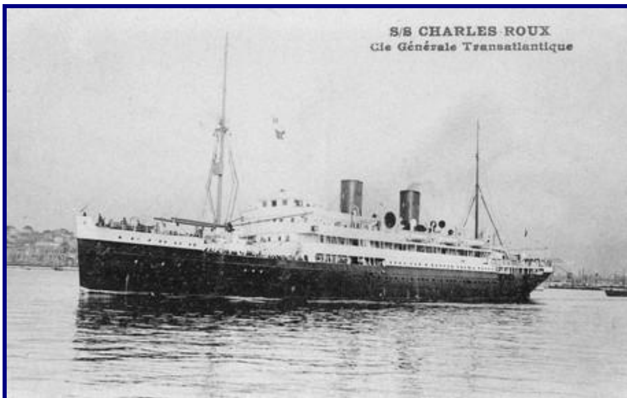
S.S. CHARLES ROUX – C ie Générale Transatlantique.