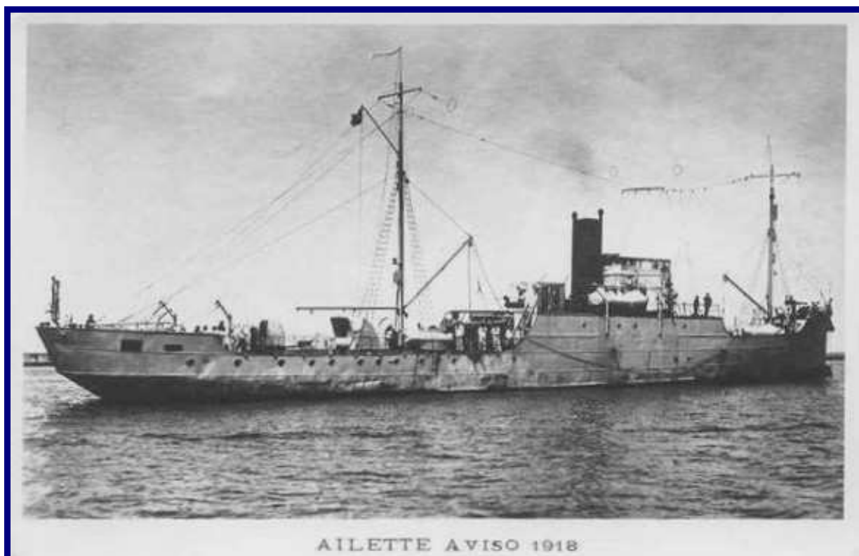
AILETTE – Aviso - 1918