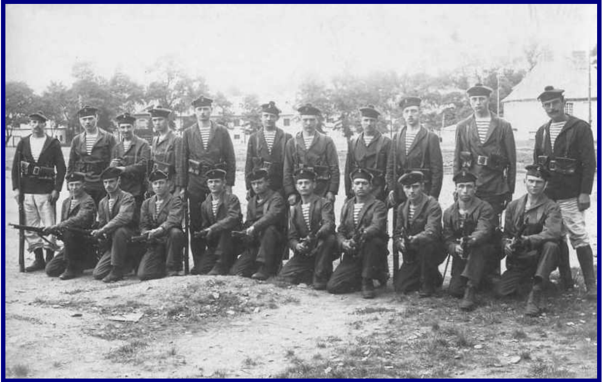
Ailette – Cherbourg – Août 1918