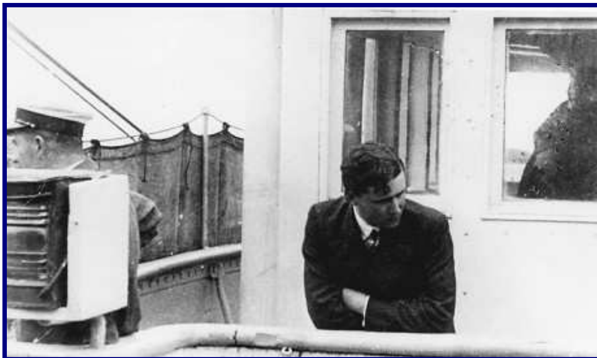
8 Juillet 1932, sur la passerelle de l'Ailette, l'EV Bienvenue rescapé du Prométhée suit la recherche du sous-marin disparu.