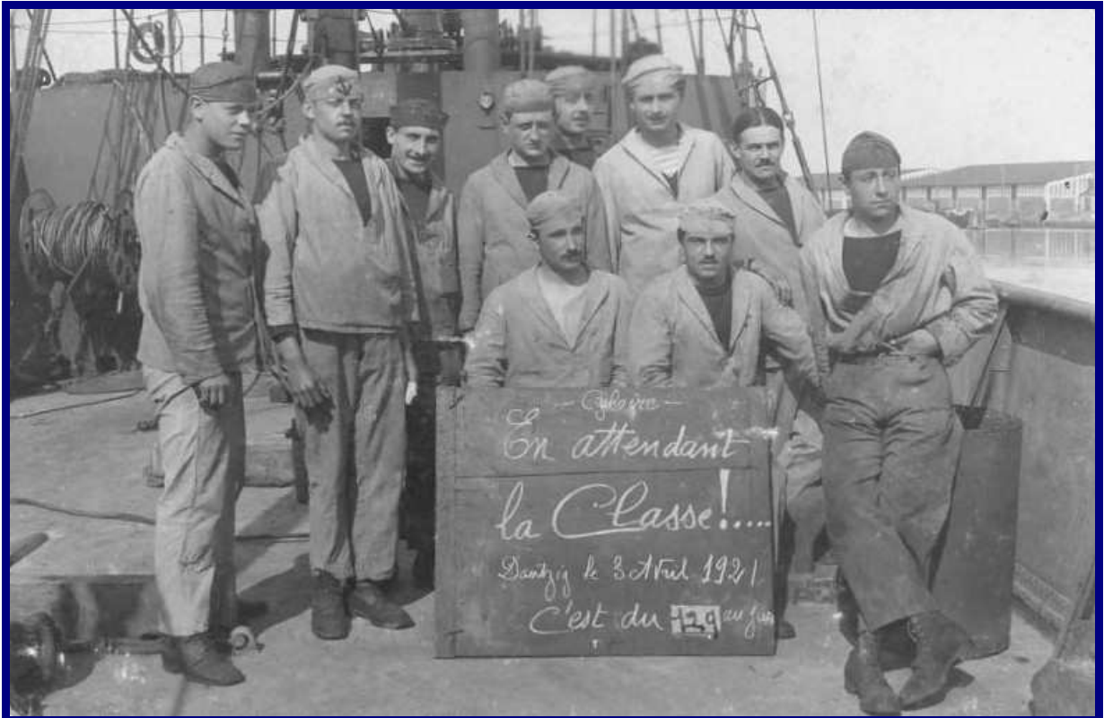
Ailette – Dantzig – Août 1921. Mécaniciens